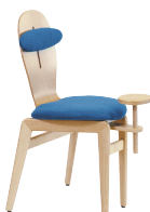
01-T Gepolstert, Tubaauflage